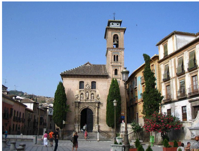
Plaza de Santa Ana